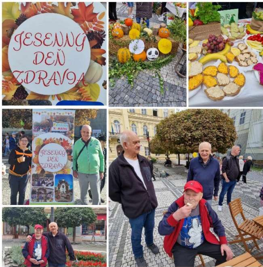
November Klub dôchodcov - návšteva