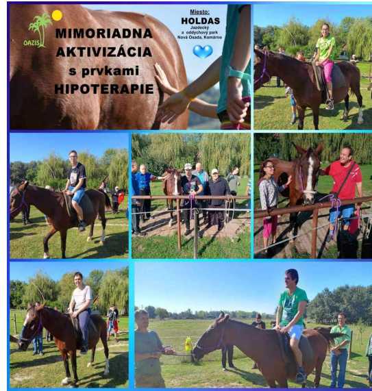
Október Jesenný deň zdravia Mesiac úcty k starším